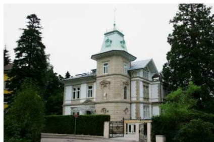
Firmensitz in Baden-Baden